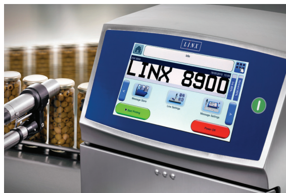
Interface utilisateur à écran tactile d'une imprimante JEC

Il est également possible de réduire les arrêts planifiés en utilisant des imprimantes modernes avec intervalles d'entretien élevés, ou des modèles à entretien/maintenance automatique, qui gèrent les changements de consommables et évitent les erreurs humaines. Les machines conçues pour une utilisation dans des environnements de fabrication avec nettoyage au jet d'eau permettent de réduire le temps passé à les couvrir ou les déplacer en vue du nettoyage.