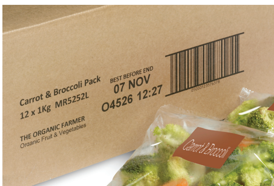
Impression de caractères de grande taille sur les emballages secondaires