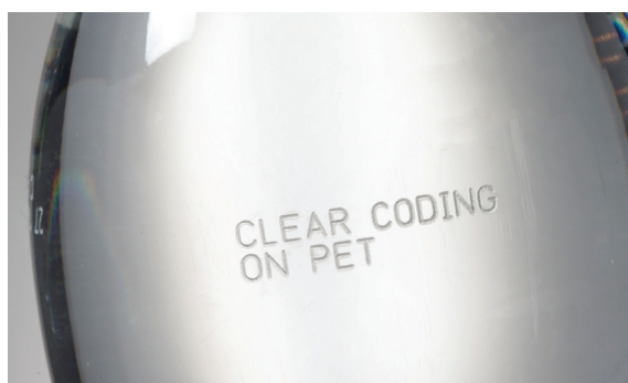
Codage laser sur PET

Les progrès de la conception ont également permis l'apparition d'une nouvelle génération de systèmes de codage laser compacts qui représentent une solution économique face aux autres technologies, tout en offrant des performances optimales.