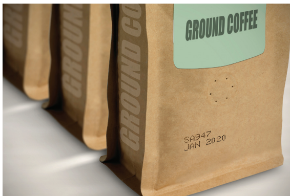
Impression JEC de données variables