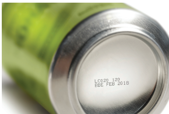
Code CEJ sur le fond concave des canettes de boissons

Les systèmes d'impression et de marquage qui combinent qualité et précision permettront de réduire les gaspillages en garantissant l'impression d'informations correctes, lisibles et au bon endroit sur le produit, en toutes circonstances.