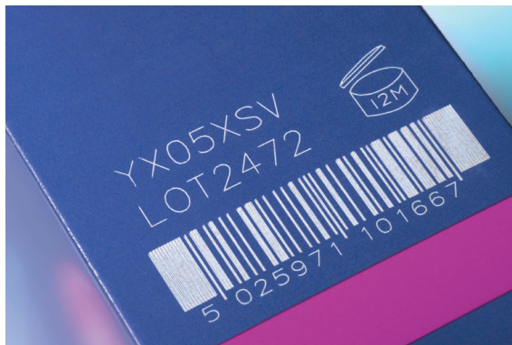
Codage complexe par impression laser sur les emballages cosmétiques

Des codes haute résolution et durables de qualité pour des informations telles que les dates de péremption, les numéros de lot ou les données de traçabilité, permettront de garantir la conformité de vos produits aux contraintes légales et aux demandes de vos clients. En outre, ils compléteront vos produits, en garantissant leur cohérence en termes d'esthétique ou d'image de marque. La gamme d'équipements disponibles, comme les imprimantes à jet d'encre continu (JEC), les systèmes de marquage laser, les imprimantes à jet d'encre thermique ou à grands caractères, permettent de sélectionner une solution adaptée à votre matériau d'emballage ou substrat spécifique, qui imprimera le type d'informations requis, des simples messages d'une ou deux lignes aux codes, graphiques et logos 2D complexes.