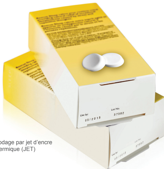
Codage par jet d'encre thermique (JET)

Les lecteurs de code-barres connectés aux équipements d'impression et de marquage permettent de sélectionner les codes automatiquement. En outre, il est possible de gérer et de contrôler des machines indépendantes ou des pools de machines depuis un ordinateur central, ou même un smartphone.