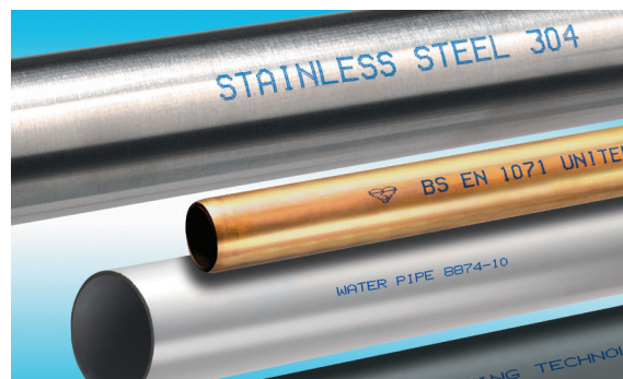
Impression JEC à l'encre bleue sur acier

La technologie à jet d'encre continu permet d'imprimer plusieurs lignes de texte et des graphiques simples à plus de 2 600 caractères par seconde. La polyvalence applicative est maximisée par la tête d'impression compacte qui